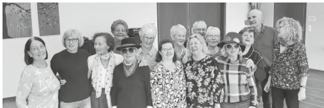
Der erste Tanzteetreff