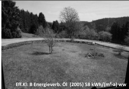
Eff.Kl: B Energieverb. Öl (2005) 58 kWh/(m²·a) ww