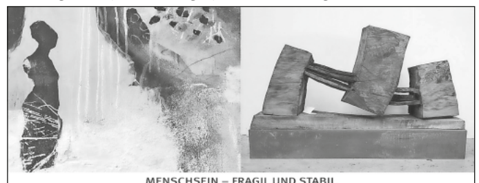
MENSCHSEIN – FRAGIL UND STABIL

Feldbergkirche / Eberlinweg 2 / 79868 Feldberg