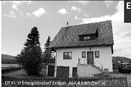
Eff.Kl: H Energiebedarf Erdgas: 464,4 kWh/(m²a)