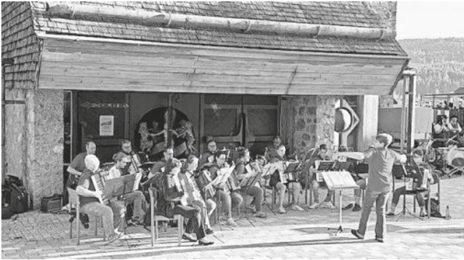
Untertitel: Doppelkonzert mit dem Harmonika Orchester Häusern

Zahlreiche Besucher durften wir zum Doppelkonzert mit dem Harmonika Orchester Häusern auf dem Kirchplatz, bei der Seenaachtsfest Eröffnung, beim Kurkonzert vor der Kirche und beim Heimatabend am vergangenen Freitag mit der Trachtentanzgruppe Schluchsee im Naturpark begrüßen.