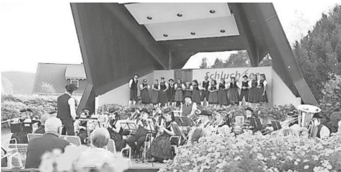
Untertitel: Heimatabend zusammen mit der Trachtentanzgruppe und Kindertrachtentanzgruppe Schluchsee

Die Zuschauer waren begeistert von den Trachtentänzen der Erwachsenen - und der Kindertrachtentanzgruppe sowie von unserer Musik. Sie dankten mit viel Applaus und genossen den lauschigen Sommerabend.