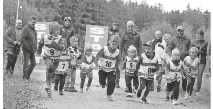
Start der Bambini