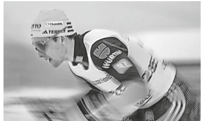
Janosch Brugger