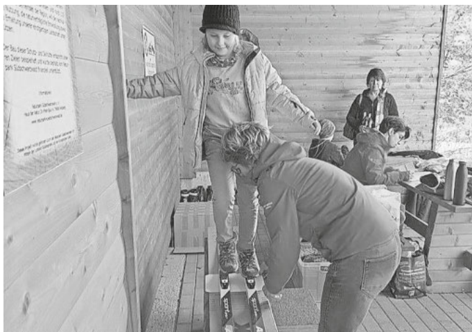
Prüfen der Spannung der LL-Ski