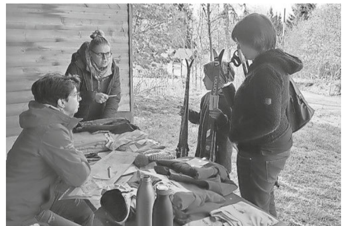
Tisch für Anmeldung und Winterkleidung

Für die WSG Schluchsee Karl-Heinz Meißner